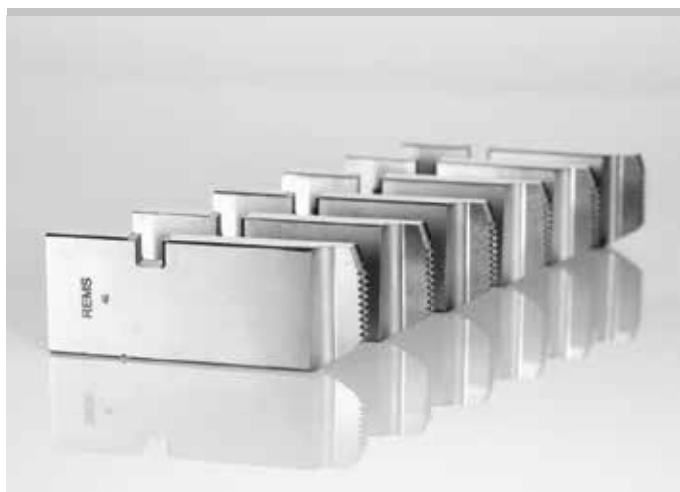
Продукция немецкого производства