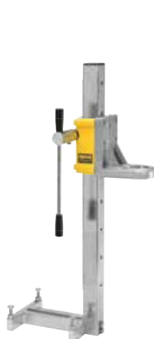
REMS Симплекс 2