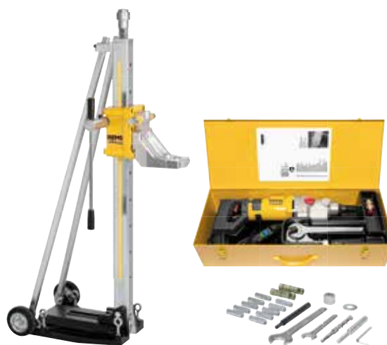
REMS Пикус S3 Сет Титан