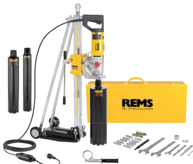
REMS Пикус S3 Сет 62-82-132 Титан