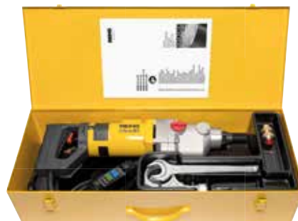
REMS Пикус S3 базовый пакет