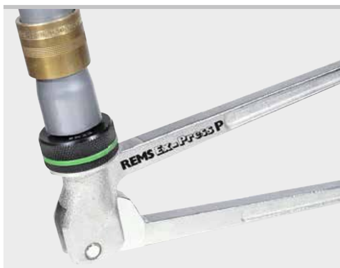
Продукция немецкого производства

напр. aquatherm, General Fittings, IVT, REHAU, REVEL, ROTEX, Seppelfricke, TECE, Würth