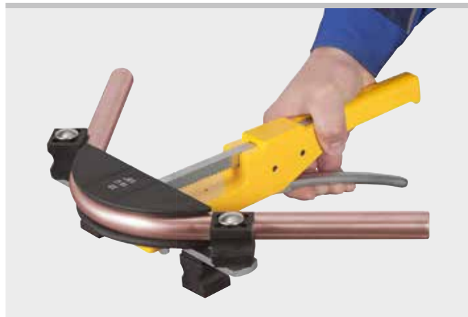
Продукция немецкого производства